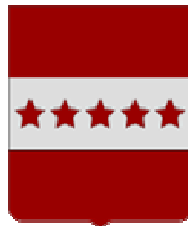
Les Bons Villers