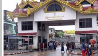
— LA FRONTIÈRE ENTRE LA BIRMANIE ET LA THAÏLANDE

UN OUVRIER DE 25 ANS, QUI A TRAVAILLÉ EN THAÏLANDE PENDANT DEUX ANS