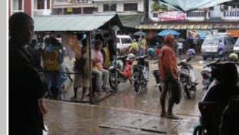
— DANS LES RUES DE MYAWADDY

UNE TRAVAILLEUSE DE 26 ANS QUI A TRAVAILLÉ À MAE SOT PENDANT 8 ANS