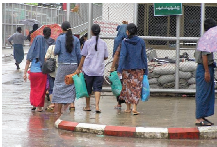
DES FEMMES TRAVERSANT LA FRONTIÈRE À MYAWADDY (MYANMAR) POUR ALLER TRAVAILLER À MAE SOT (THAÏLANDE)

En juillet 2006, nous avons interviewé 35 migrants birmans travaillant dans l'industrie textile à Mae Sot. Nous voulions identifier les principaux problèmes que rencontrent les migrants dans leur travail. On trouve une série de points communs, comme la rétention de documents d'identité, les salaires impayés, les restrictions imposées aux syndicats et les conditions de travail dangereuses.