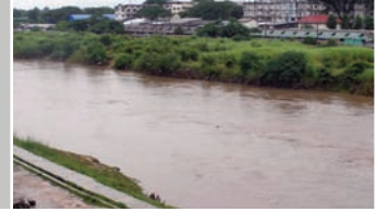
— LE FLEUVE QUI SÉPARE LE MYANMAR (BIRMANIE) DE LA THAÏLANDE

le droit du travail n'est pas appliqué. Souvent, les militants syndicaux sont victimes d'intimidation ou de répression de la part du gouvernement ou des employeurs. Là où les syndicats sont autorisés, les travailleurs migrants qui souhaitent s'organiser se heurtent à de nombreux obstacles. La crainte de s'attirer les foudres des employeurs ou de la police constitue un frein important, surtout lorsqu'on est un travailleur migrant sans papiers. Dans certains pays, des restrictions sont imposées aux étrangers qui veulent s'affilier à un syndicat ou briguent une fonction officielle. En Thaïlande, par exemple, seuls les Thaïs de nationalité ont le droit de créer un syndicat.