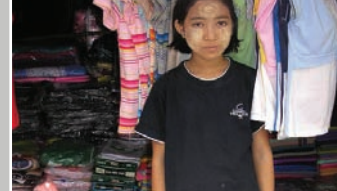
— JEUNE FILLE BIRMANE VENDANT DES VÊTEMENTS FABRIQUÉS LOCALEMENT AU MARCHÉ DE MYAWADDY