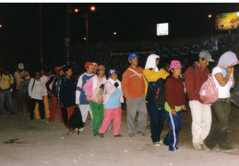
LA MAJORITÉ DES OUVRIERS VIVENT DANS LES FAUBOURGS DE VILLES EN PLEIN ESSOR, CE QUI POSE LE PROBLÈME DE L'ACCÈS AU TRAVAIL. LE TRAJET PREND ENTRE 30 ET 90 MIN.