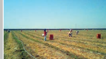
— LA RÉCOLTE DES ASPERGES