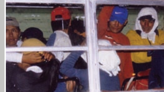
— UN BUS DE TRAVAILLEURS BONDÉ