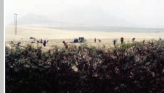
— UN CHAMP D'ASPERGES