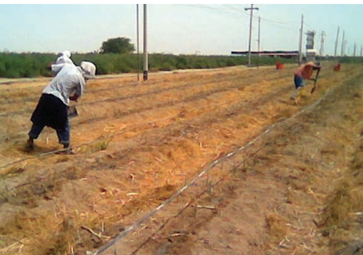
LES TRAVAILLEURS DANS UN CHAMP D'ASPERGES