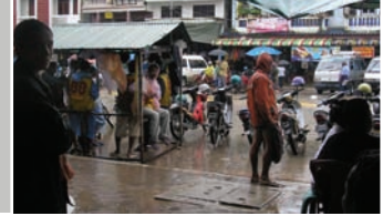
— MAE SOT ALBERGA UNA POBLACIÓN MIGRANTE COMPUESTA POR UNOS 150 000 TRABAJADORES, LA MAYORÍA DE ELLOS BIRMANOS

Muchos de ellos son migrantes indocumentados que corren el riesgo de ser deportados. Recientemente Tailandia ha adoptado una actitud más abierta para con los trabajadores sin papeles y ahora concede permisos de trabajo por un año. Teóricamente ese documento les otorga a los migrantes los mismos derechos que tienen los trabajadores tailandeses. Sin embargo, los trabajadores no pueden cambiar de trabajo sin contar para ello con el permiso escrito de su empleador. Si abandonan su trabajo o son despedidos pueden ser deportados a menos que consigan otro trabajo en un plazo de siete días. En la práctica esta alternativa no existe puesto que los empleadores acostumbran confiscar los permisos de trabajo y se niegan a devolvérselos a los trabajadores que dejan de trabajar para ellos.