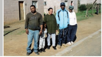
OPERAI DAVANTI ALLE LORO ABITAZIONI