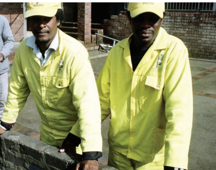
OPERAI SU UN CANTIERE

I sindacati potrebbero giocare un ruolo importante nel programma assicurando, ad esempio, che l'EPWP raggiunga le persone con maggiori necessità, che la formazione sia efficace e che le autorità locali si impegnino a garantire un'occupazione sostenibile.