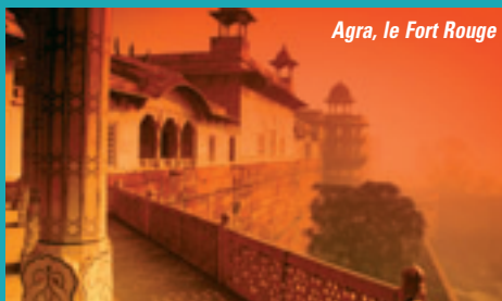
Agra, le Fort Rouge