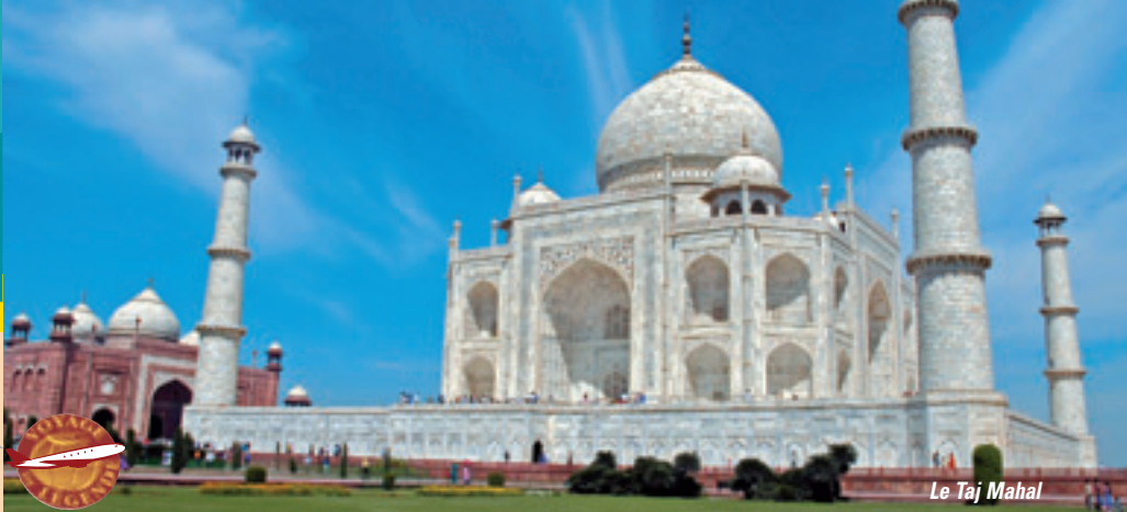
Le Taj Mahal