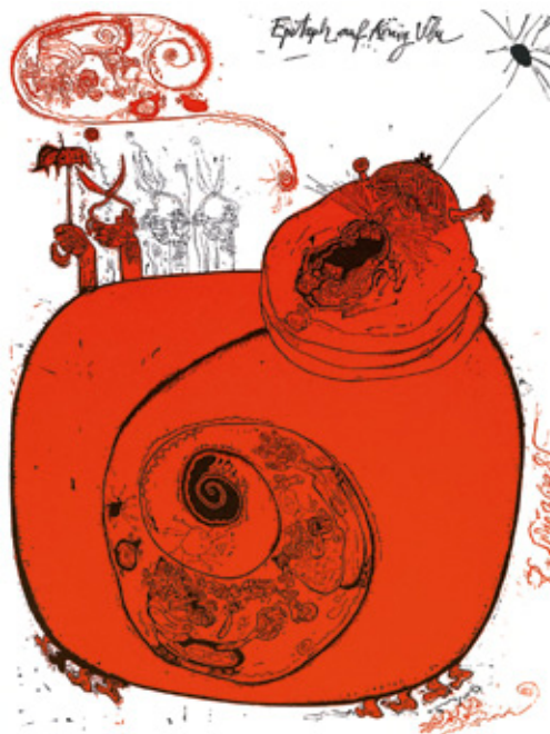
© Rudolf Schönwald, Epitaph auf König Ubu, 1972

Tél. 04 250 26 50 | E-mail : info@lecomptoir.be